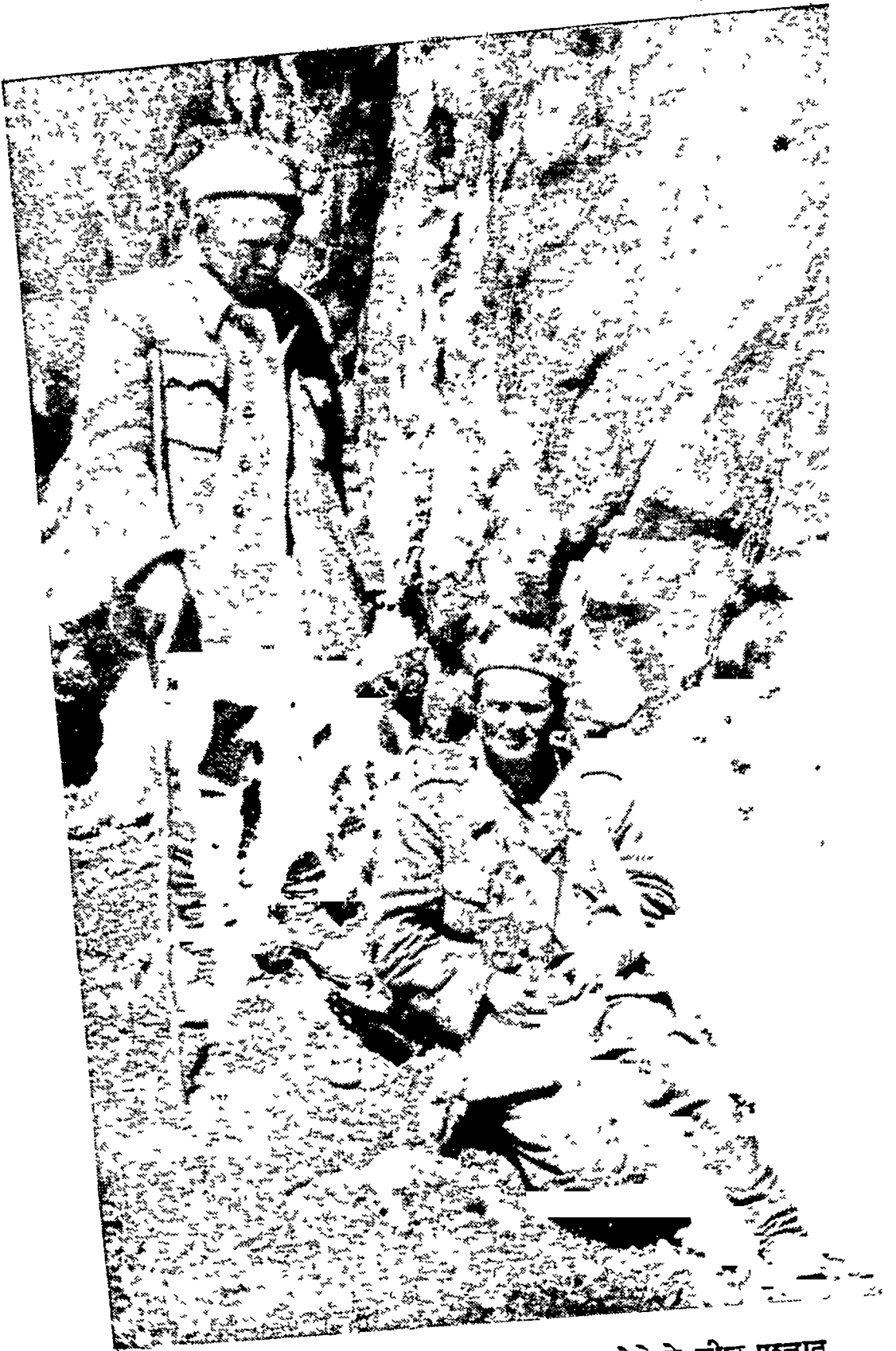
टीटो जून सन् १९४३ में घायल होने के शीघ्र पश्चात् डॉ० ईवान रिबार के साथ