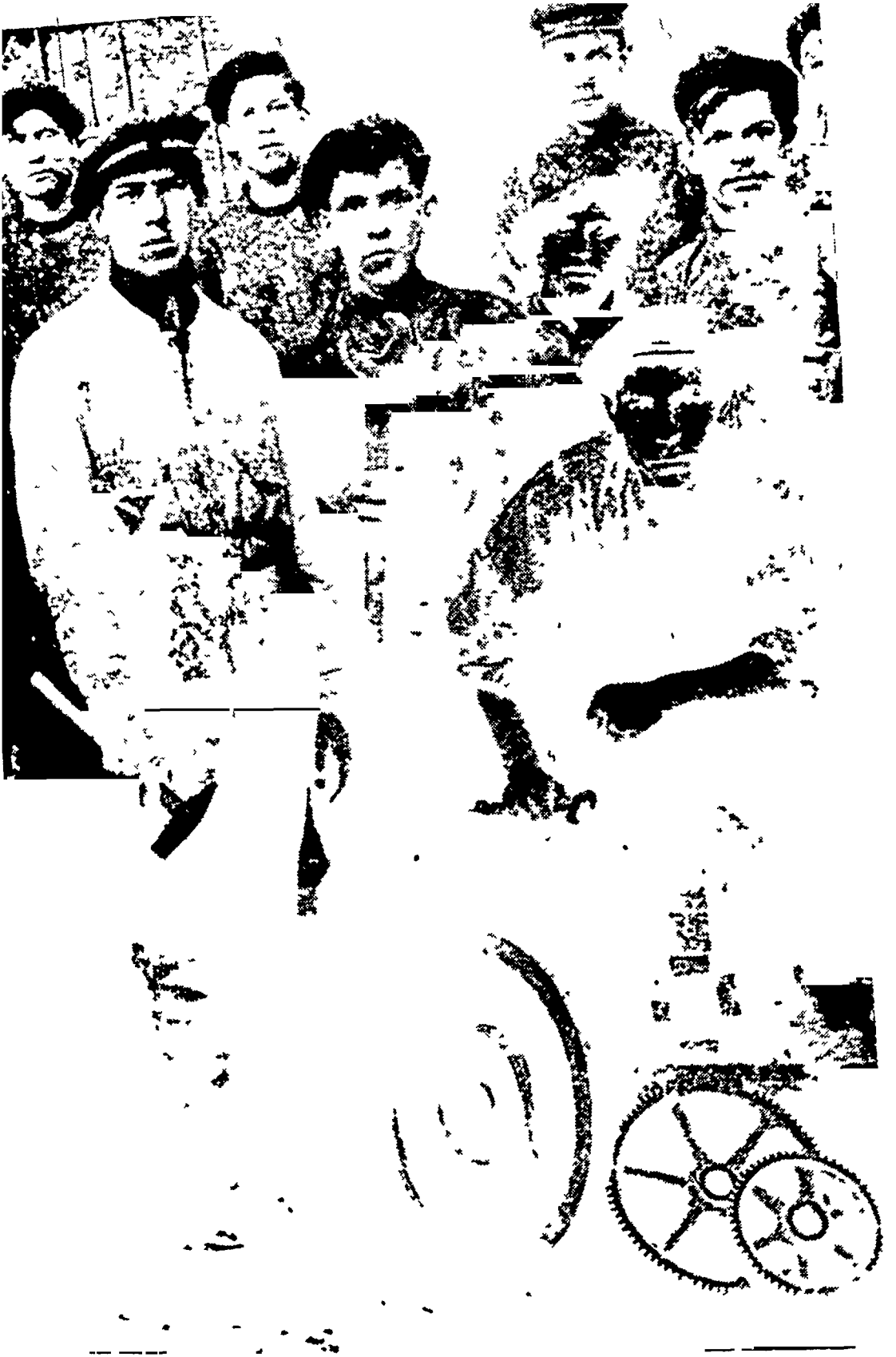
योसिप ब्रोझ (पीछे बायें से दूसरे) १९ वर्ष की अवस्था में स्लोवीनिया में कामनिक के मजदूरों की एक टोली के साथ